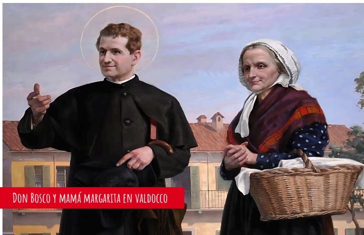
DON BOSCO Y MAMÁ MARGARITA EN VALDOCCO