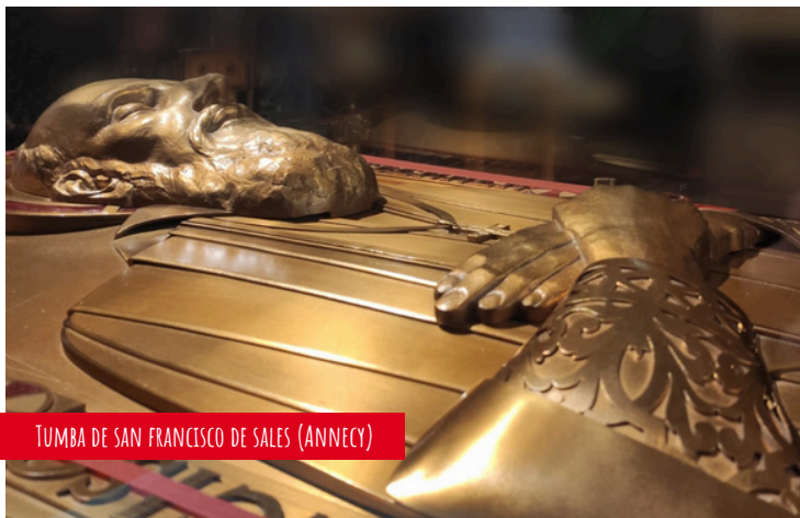
TUMBA DE SAN FRANCISCO DE SALES (ANNECY)