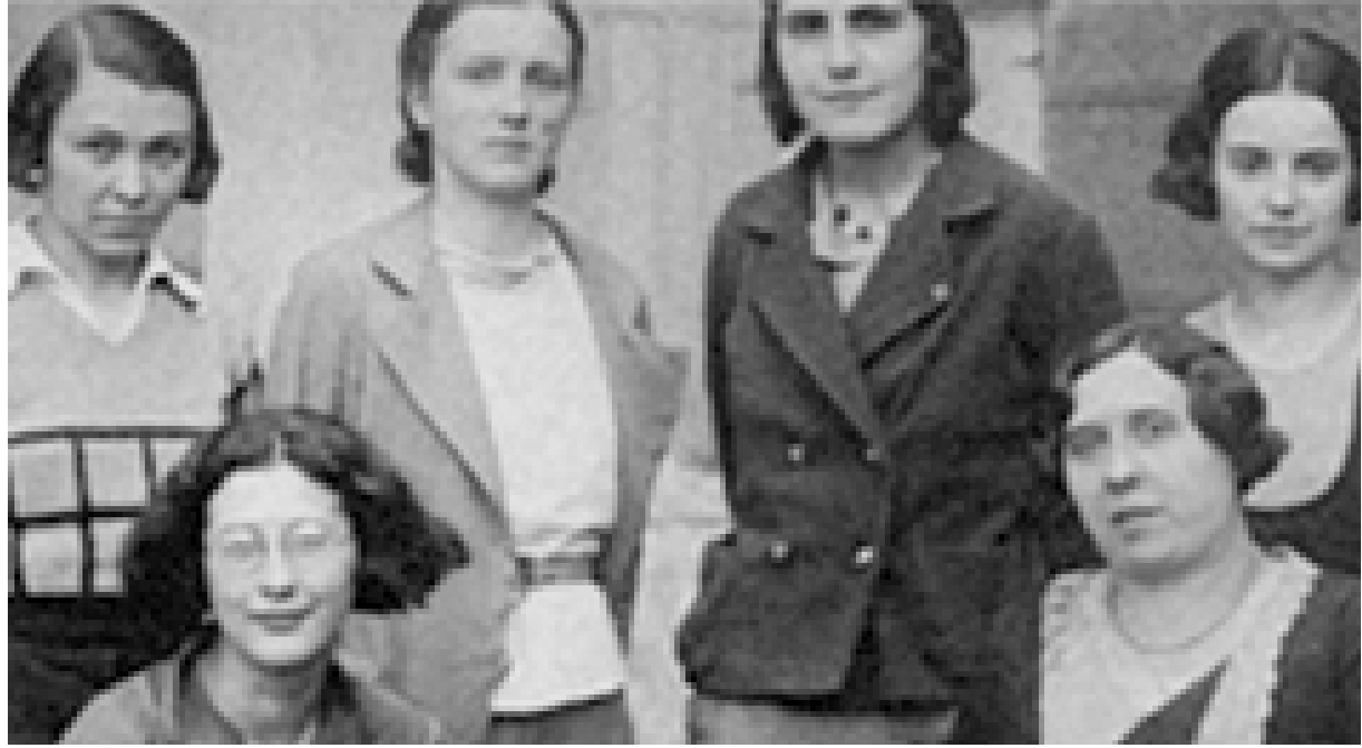
Foto de Simone Weil en Roanne