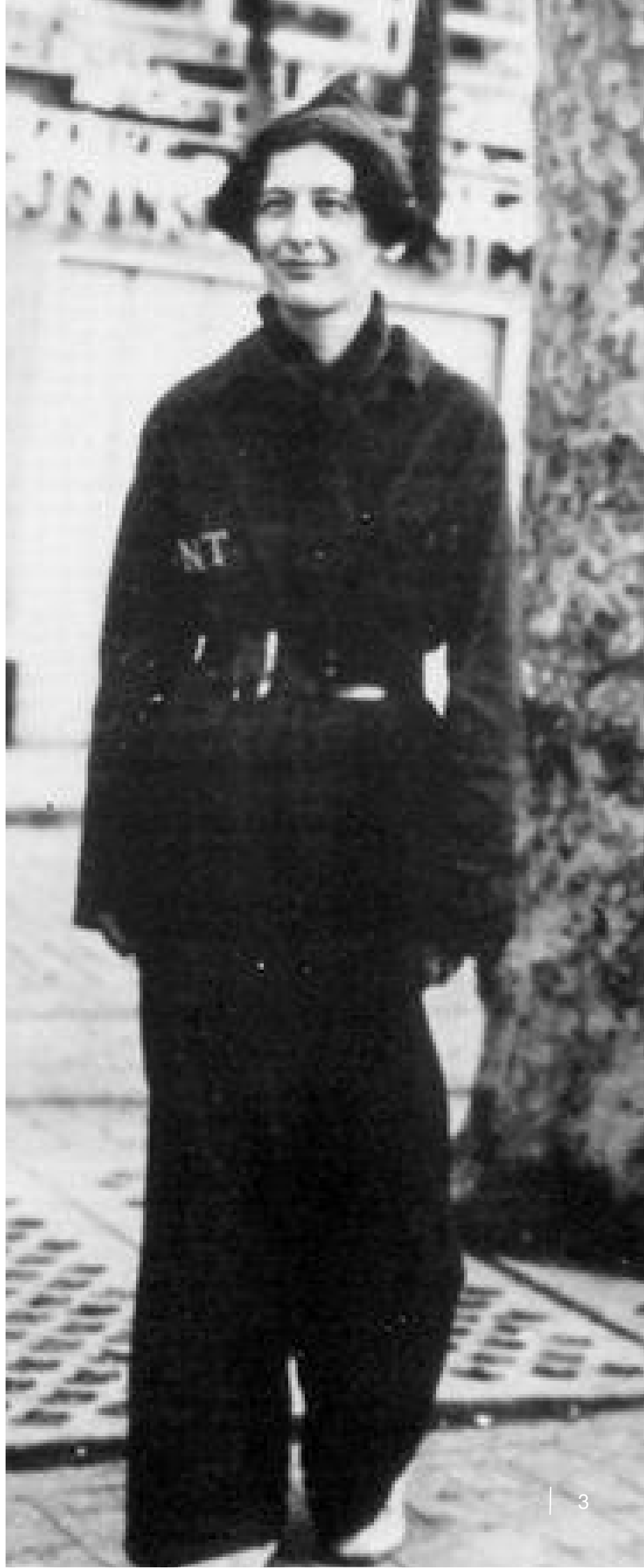
Foto de Simone Weil en España

Sin embargo, un grave accidente la obligó a darse de baja y dejar Alsthom.