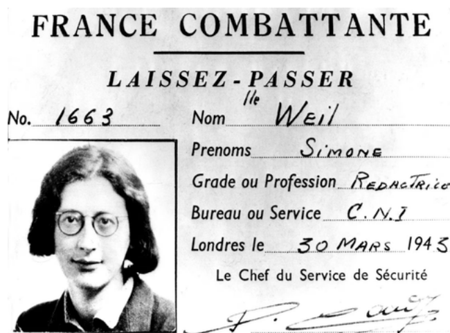
Pase de Simone Weil (1909-1943), cuando trabajaba para la resistencia francesa, expedido meses antes de su muerte.

La muerte de Simone, ocurrida a la temprana edad de 34 años, dejó un profundo dolor en aquellos que conocieron su valía y su espíritu inquebrantable. Según el informe de muerte, se determinó que Simone se había negado a sí misma la ingestión suficiente de alimentos, lo que llevó al diagnóstico de tuberculosis.