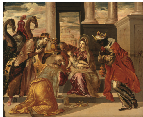
La Adoración de los Reyes Magos (1568) El Greco